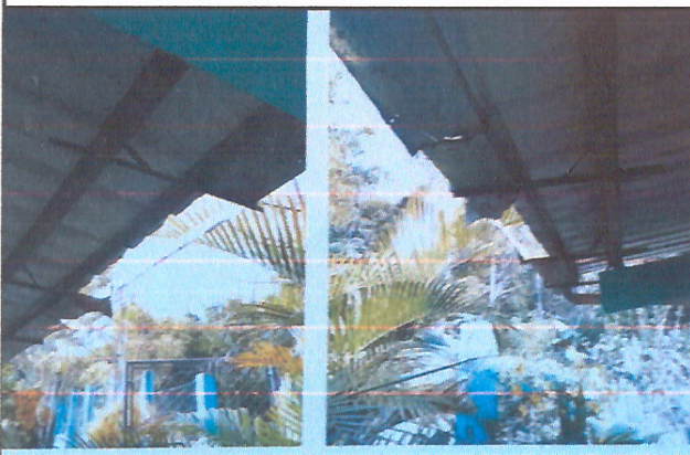
Mejoramiento de canales de agua