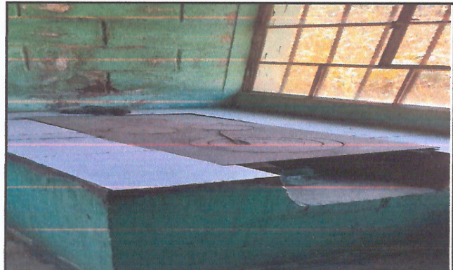
Mejoramiento de plancha y chimenea de cocina