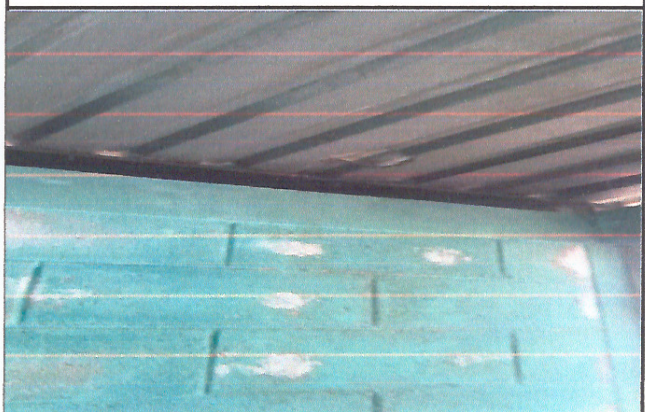
Mejoramiento de techo en cosita

Observación: Si es necesario se pueden agregar hojas adicionales y actualizar el número de hojas.