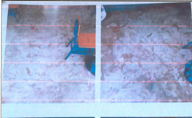
Mejoramiento de piso en aulas